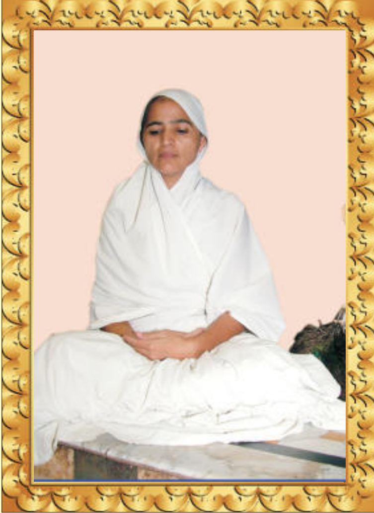
आर्यिका श्री १०५ अधिगममति माता जी

नहीं गुणों की गृहिका, रही इन्द्रिया और। तभी जितेन्द्रिय जिन बने, लखते गुण की ओर॥८०॥