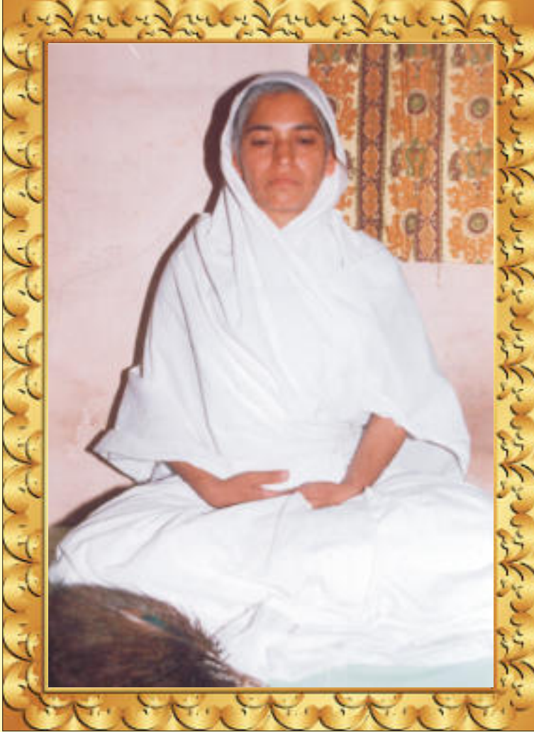
आर्यिका श्री १०५ कैवल्यमति माता जी रस से रीता हूँ रहा, ममता की ना गन्ध। सौरभ पीता हूँ सदा, समता का मकरन्द ॥ ९९ ॥