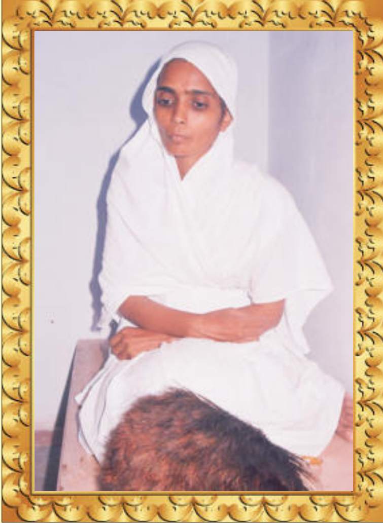
आर्यिका श्री 105 शीलमति माता जी

सुर नर यति पति पूजते, सुध बुध सभी विसार। गुरू गौतम गणधर नमूँ, उमंग से उर धार ॥ 4 ॥