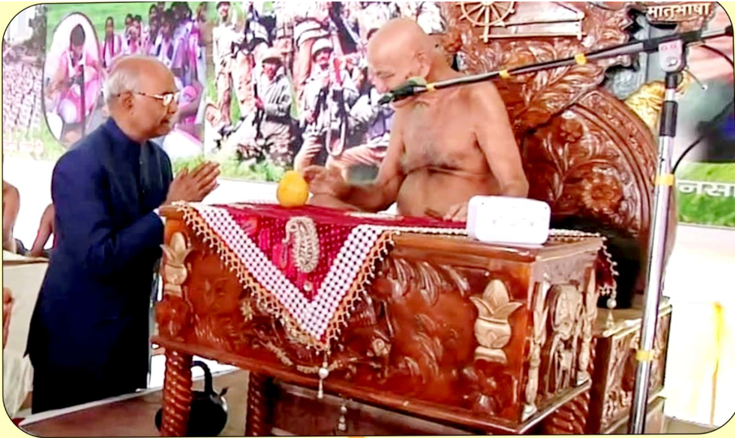
आचार्य श्री १०८ विद्यासागर जी महाराज के दर्शन करते हुए भारत के राष्ट्रपति श्री रामनाथ कोविंद जी